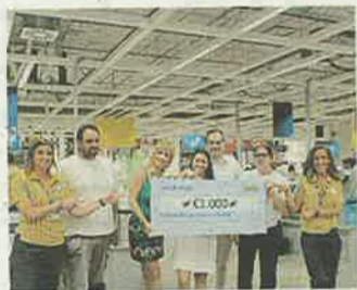
La ganadora, con el tarjetón de regalo.

Durante la noche del pasado domingo, una patrulla de la Policía Local procedió a la detención de un hombre que se encontraba con medio cuerpo introducido por la ventanilla de un coche en la calle Curros Enríquez. El autor del robo resultó ser un vecino de Sanxenxo.