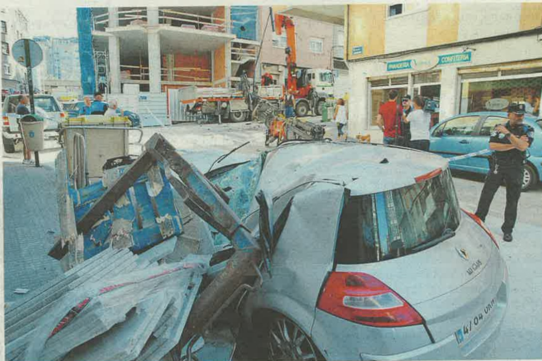
El brazo de la grúa y su carga se desplomaron sobre un vehículo, que quedó destrozado. PACO RODRÍGUEZ

Agentes de la Policía Local procedieron a cortar el tráfico en Ángel Rebollo para que los bomberos pudieran realizar los trabajos de limpieza, desmontaje y prevención de nuevos desprendimientos, que se prolongaron