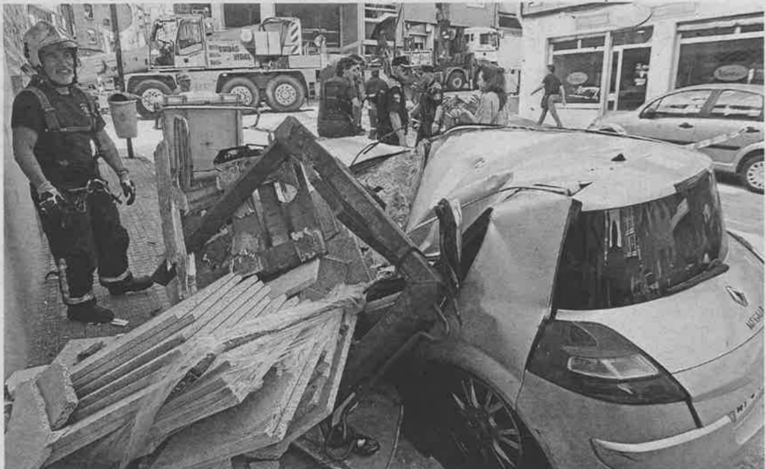
El vehículo alcanzado, un Megane procedente de Ourense, quedó reducido a chatarra

La carga acabó hecha añicos sobre la acera, mientras que el brazo cayó sobre el parabrisas de un Megane, que resultó siniestro total. Según fuentes de la Policía Local, el propietario del vehículo procedía de Ourense, y no pudo ser localizado, por lo que la grúa